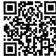
濃厚接触者、症状がある場合